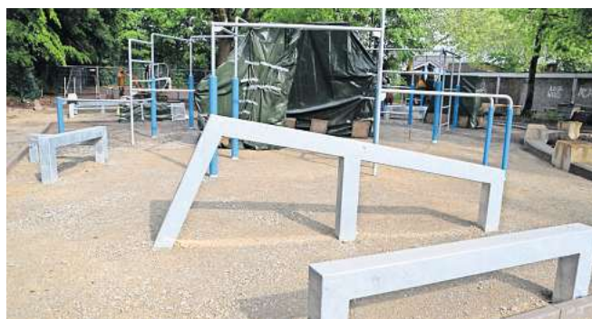
Die Parkour-Anlage ist auf Wunsch von Garbsener Jugendlichen geplant worden.

Die Parkour-Anlage ist auf Wunsch von jungen Leuten in Garbsen geplant worden, die Sportart ist hier sehr beliebt. Der Bau hat rund 250 000 Euro gekostet. Für den letzten Feinschliff hatten die Jugendlichen selbst gesorgt. Gemeinsam mit dem Künstler Patrik Wolters alias BeNeR1 aus Osterwald sprühten sie Graffiti auf Metallteile der Anlage.