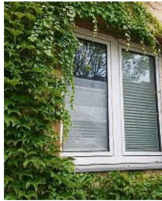
Die Fensterscheibe ist zerbrochen.

tägliche Verbrauch hat die Wasserabgabe wieder an die Spitzenauslastung der Anlagen geführt. Der WVGN bittet alle Kunden um einen umsichtigen und wohl dosierten Umgang mit Trinkwasser. Selbstverständlich ergreift der Verband alle erforderlichen Maßnahmen zur Erhöhung der eigenen Gewinnungsmengen. Neue Brunnen wurden, wie der WVGN im März berichtete, im Wasserschutzgebiet Hagen und im Wasserschutzgebiet Forst Esloh in Betrieb genommen. Der Bau weiterer Brunnen ist geplant um ältere Brunnen mit abnehmender Ergiebigkeit zu ersetzen.